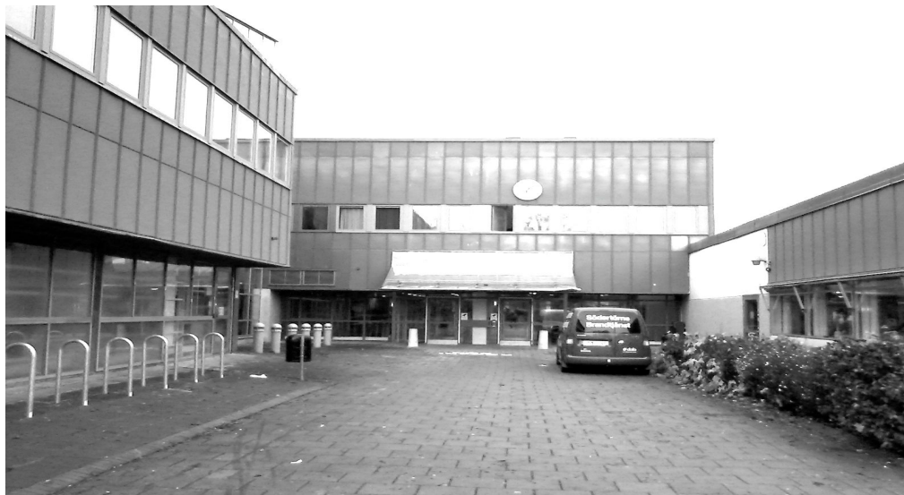
Ingången till Tumba Gymnasium

”Min första tanke är att det är en negativ bild. Men när jag tänker efter lite så inser jag att alla scener inte är negativa. Som rika människor som använder sina pengar till att spela och ha kul. Det är inget direkt negativt med det.”